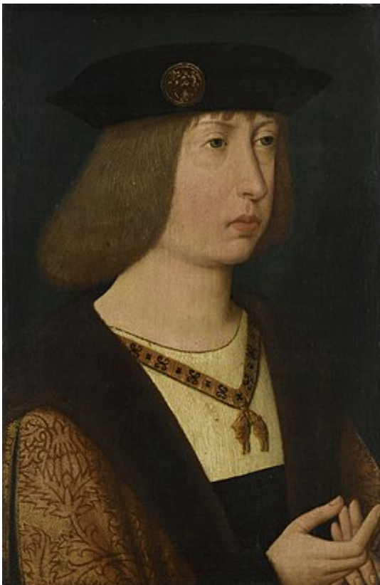
Afbeelding 3. Filips de Schone, de vorst met wie Willem te maken had in de laatste jaren tussen 1494 en 1500