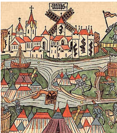
Afbeelding 4. Slag bij Neuss (29 juli 1474 – eind mei 1475), waar Willem tot ridder werd geslagen door Karel de Stoute