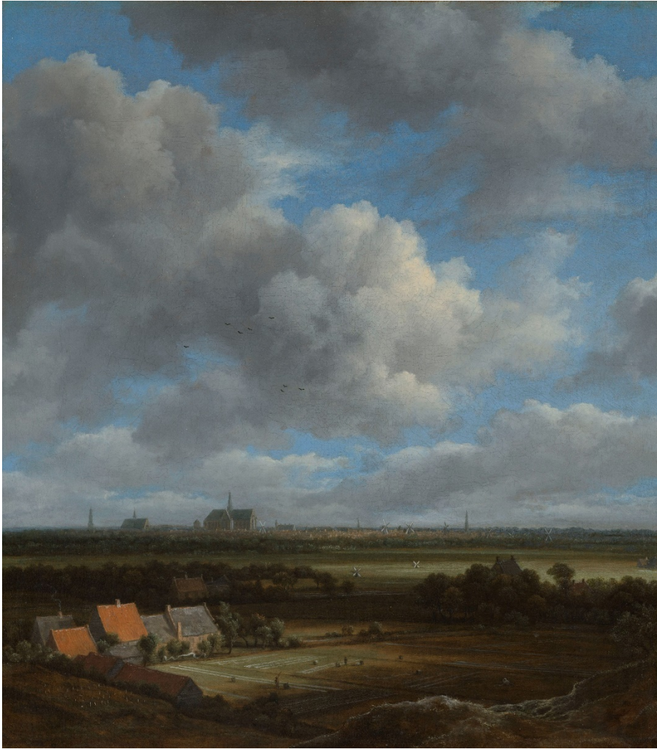
Afbeelding 3. Gezicht op Haarlem uit het noordwesten, met de blekerijen op de voorgrond, Jacob Isaaksz. van Ruisdael, ca. 1650 – ca. 1682 (Rijksmuseum Amsterdam)