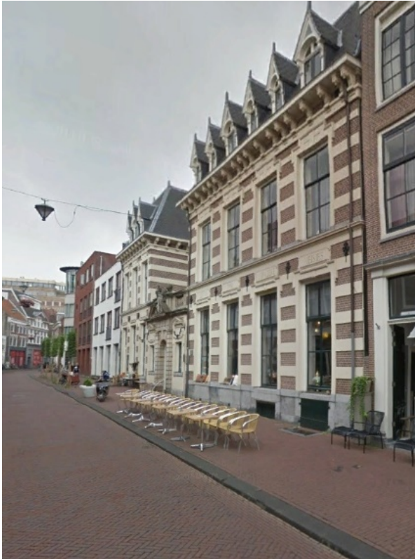
Afbeelding 2. Het huis van Schagen, Koningstraat in Haarlem