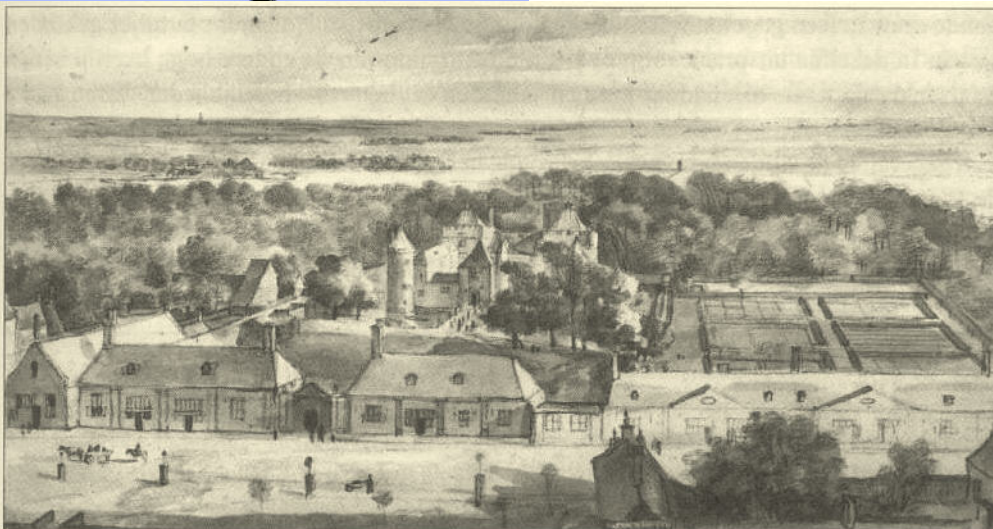
Roghman, het slot van Schagen met voorgebouwen