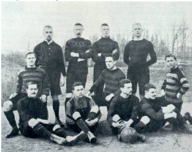
Elftalfoto R.A.P. 1899

Ook bij de leden van Sparta is de sympathie voor de voor onafhankelijkheid strijdende Afrikaanse Boeren groot. Dit brengt het bestuur, na het horen over het bezoek van Paul Kruger aan Rotterdam, tot het organiseren van een benefiet rond de competitiewedstrijd van 29 oktober 1899 tegen RAP. Deze club is in 1899 voor de derde keer op rij en dit keer zelfs geheel ongeslagen kampioen van de Westelijke eerste klasse geworden.