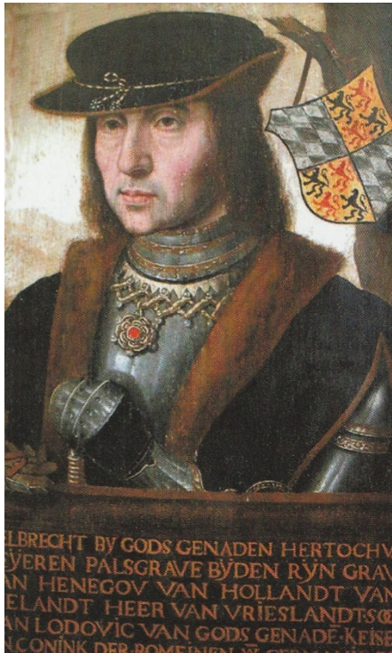
Afb. 5; Albrecht van Beijeren, grootvader van Albrecht van Beijeren van Schagen) (uit Slot Schagen)