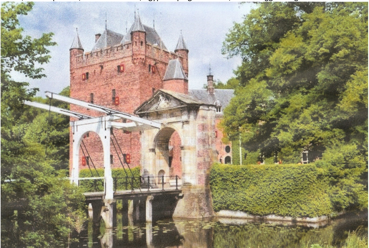
Afb. 3; Kasteel Nijenrode