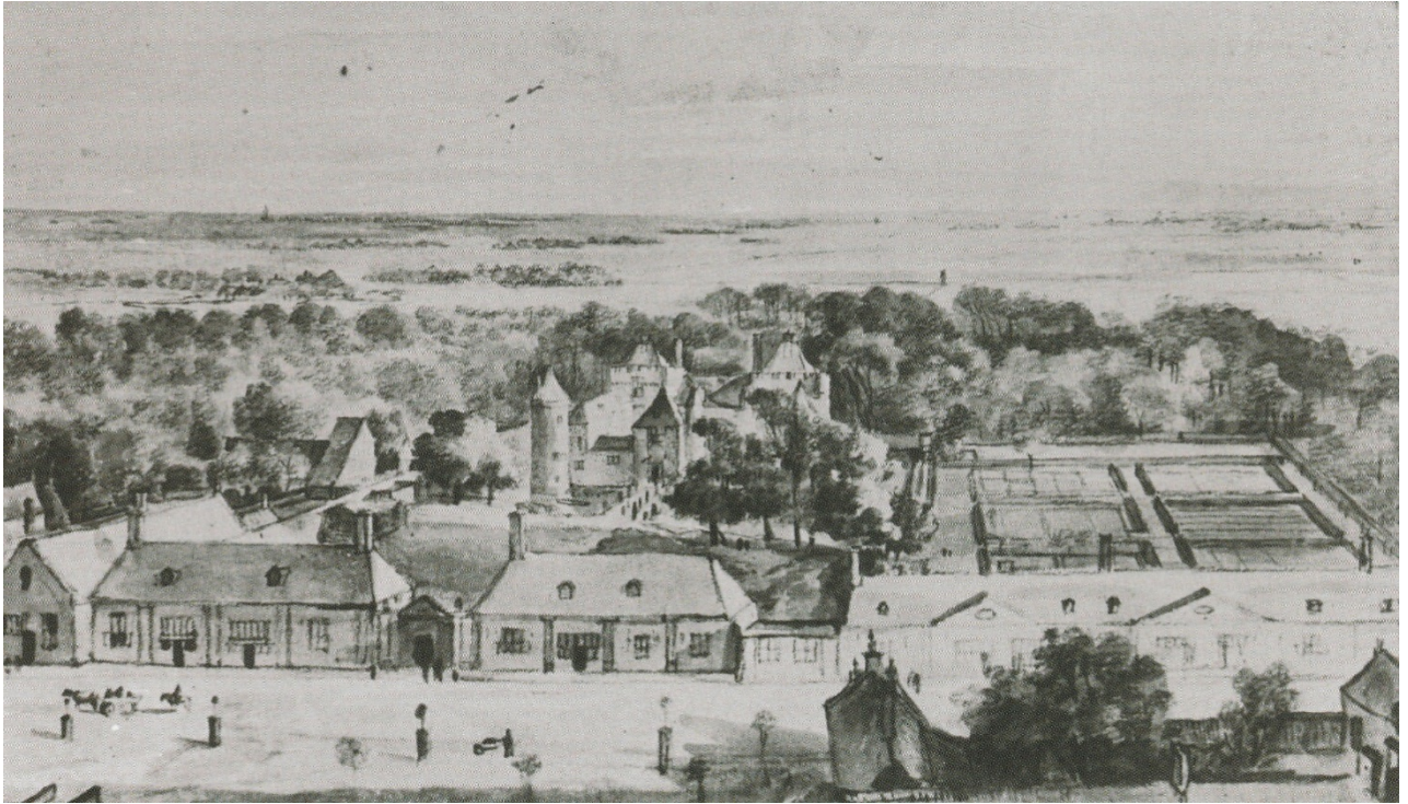
Afb. 1; Slot Schagen (Roghman, 1466/1467)