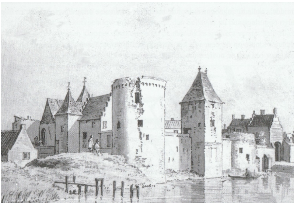
Afb. 2; Kasteel Radboud, prent uit de 17 e eeuw (uit Slot Schagen)