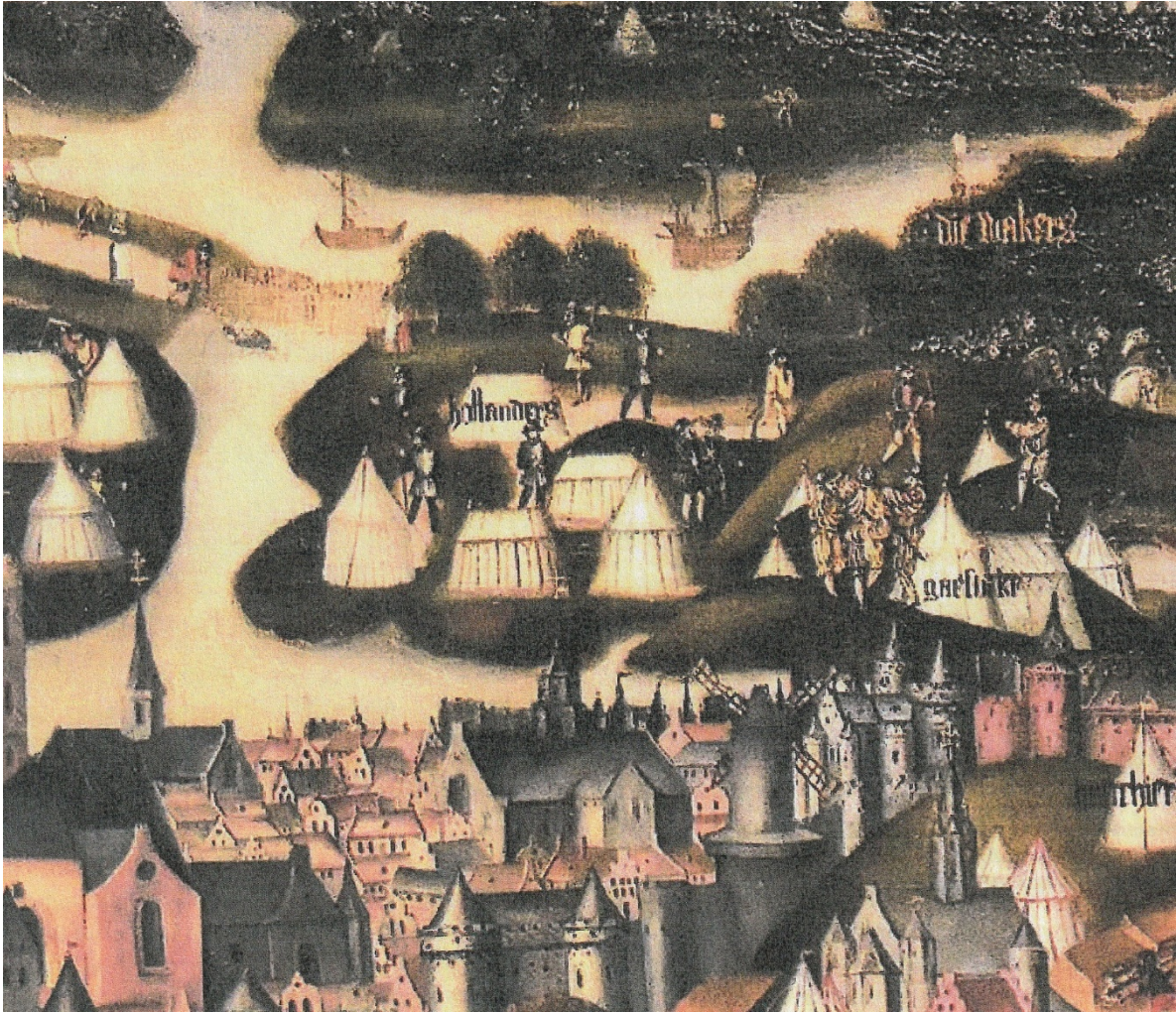
Afb. 3; De kampementen bij belegering van de stad Neuss met in het midden 'de Hollanders' (16 e eeuw, Hof van Buysleyden, Mechelen)