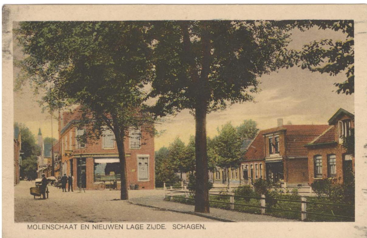
Hier zien we de winkel, het 2 e pand van rechts, vanuit de Molenstraat. Deze kaart is verzonden op 11 augustus 1922.