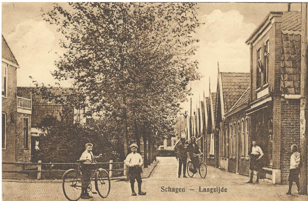
Midden jaren Twintig. Op deze ansicht is de schotel aan de gevel goed te zien.