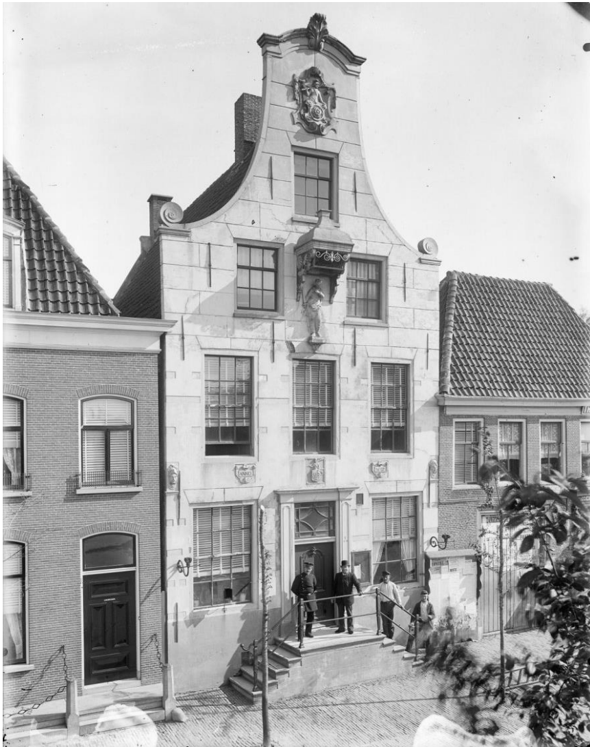
Collectie Rijksdienst voor het Cultureel Erfgoed, objectnummer 20194853.

Het mooie plaatje hierboven is gemaakt in juni 1895. De naam van de fotograaf is niet bekend, maar het zou mij niet verbazen wanneer dit een foto van Niestadt zou zijn. Het is het oude raadhuis van Schagen voor de verbouwing in 1898. Bij die verbouwing is de klokgevel vervangen door een trapegevel. Op onderstaande uitsnede van een andere foto is duidelijk te zien dat er mooie gevelstenen aanwezig waren, waaronder een steen met daarop "ANNO" links en rechts een steen met het jaartal 1612.