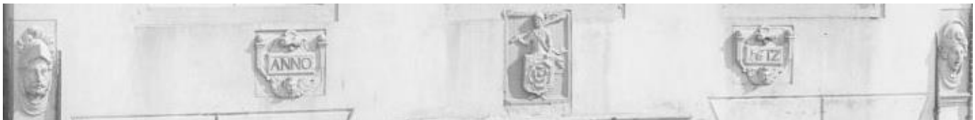
Collectie Rijksdienst voor het Cultureel Erfgoed, objectnummer 20194855 (uitsnede)

Het mooie plaatje hierboven is gemaakt in juni 1895. De naam van de fotograaf is niet bekend, maar het zou mij niet verbazen wanneer dit een foto van Niestadt zou zijn. Het is het oude raadhuis van Schagen voor de verbouwing in 1898. Bij die verbouwing is de klokgevel vervangen door een trapegevel. Op onderstaande uitsnede van een andere foto is duidelijk te zien dat er mooie gevelstenen aanwezig waren, waaronder een steen met daarop "ANNO" links en rechts een steen met het jaartal 1612.